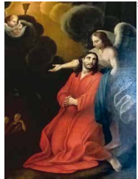
Jésus consolé au jardin des Oliviers, église de Sainte-Foy-la-Grande.

N'empêche ! La solitude est le propre de l'homme. Les animaux vivent pour vivre dans l'instant présent. Vis-à-vis de la mort, leur solitude n'est pas la nôtre. Ils sont cependant une aide pour comprendre. Leur compagnie domestique redonne le goût d'écouter et d'attendre, de s'arrêter. Leur mort, notamment pour des personnes âgées, accroît souvent des problèmes émotifs et physiques, des inquiétudes, de l'anxiété, des questionnements quant à la mort personnelle. La solitude peut être alors facteur de risque de dépression et de laisser-aller. Or, c'est le lâcher-prise qui laisse place à la lucidité dans la mémoire fondatrice de la confiance et de la vie toujours la plus forte, qui vient consoler, accompagner la solitude, avec l'énergie de tant de combats et d'amours passés, dignes de foi et d'espérance. Peter Schjeldahl, né écrivain juste avant sa mort, la fin de sa solitude, s'interroge sur le sens de sa propre vie dans un doute positif : « C'est