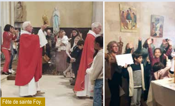
Fête de sainte Foy.