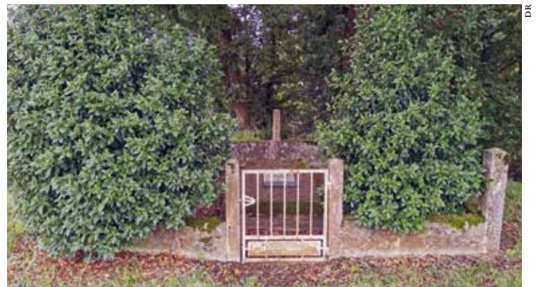
Une tombe isolée à Pessac-sur-Dordogne.

> Pour en savoir plus, consultez le livre de Louis Eckert, Tombes et cimetières privés du pays de la Force , aux éditions de l'Arah.