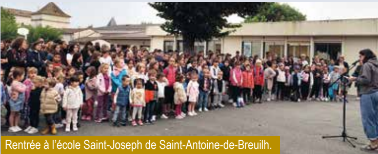
Rentrée à l'école Saint-Joseph de Saint-Antoine-de-Breuilh.