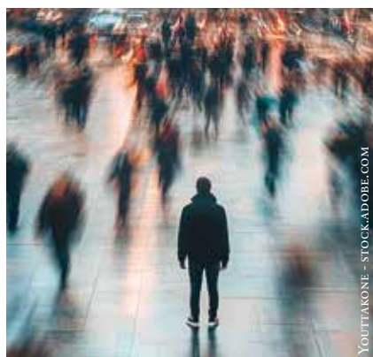
Seul au milieu de tous.

Le chômage peut, également, engendrer une solitude psychologique considérable. Les personnes au chômage peuvent ressentir de la honte, de l'inutilité et une diminution de leur estime de soi, aggravées par la stigmatisation sociale. L'absence de statut professionnel peut accroître le stress. La solitude peut exacerber ces sentiments, rendant chaque jour plus difficile à affronter.