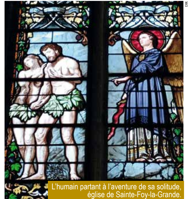
L'humain partant à l'aventure de sa solitude, église de Sainte-Foy-la-Grande.

invite chacun « à prendre sa croix et le suivre » (Mc 8, 34), Lui, « le chemin qui mène à la vérité et la vie » (Jn 14, 6). Car avant, personne ne va vers le Père sans passer par lui. Avec le Messie, le Fils de l'homme, quittant nos solitudes, nous devenons frères, et même amis de Dieu. « Je ne vous laisserai pas orphelins, je reviens vers vous » (Jn 14, 18). « Je suis avec vous tous les jours jusqu'à la fin du monde » (Mt 28, 20). « Aimez-vous les uns les autres comme je vous ai aimés » (Jn 13, 34).