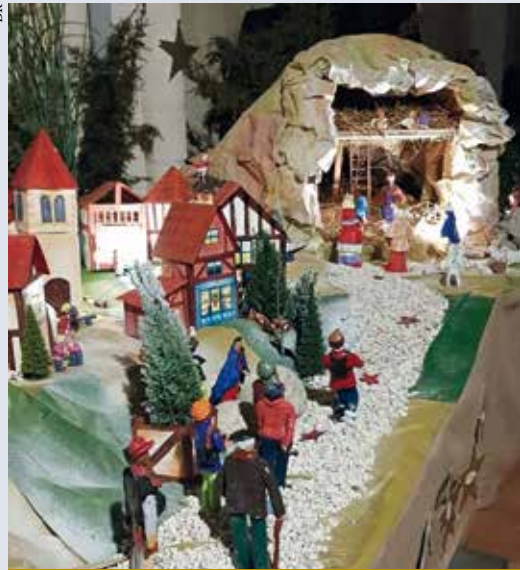
La crèche dans l'église de Sainte-Foy-la-Grande, en 2023.

Pour la publicité, cette magie est le fruit de notre consommation. Beaucoup la trouvent dans nos rues lumineuses et colorées, au cœur de l'hiver, ou sur la table du réveillon, bien décorée et bien garnie. Noël, c'est un peu cela et, pour beaucoup, c'est une fête importante qui touche la famille et notamment les enfants, qui sont comblés de cadeaux.