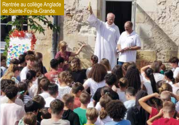
Rentrée au collège Anglade de Sainte-Foy-la-Grande.