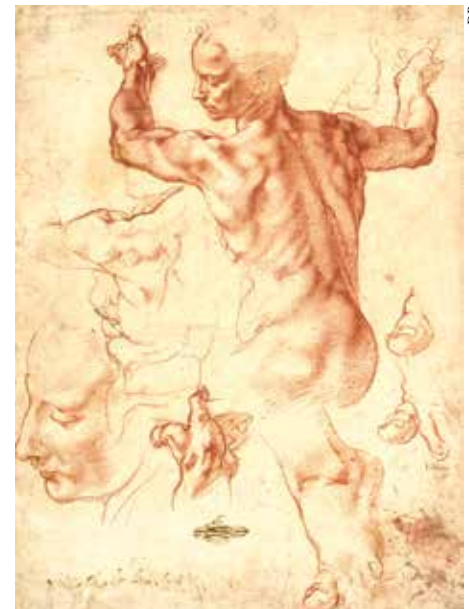
Esquisse de la sibylle d'Erythrée.

Selon Benoît XVI, dans son discours pour le 500 e anniversaire de la chapelle Sixtine : « Avec une intensité expressive unique, le grand artiste représente le Dieu créateur, son