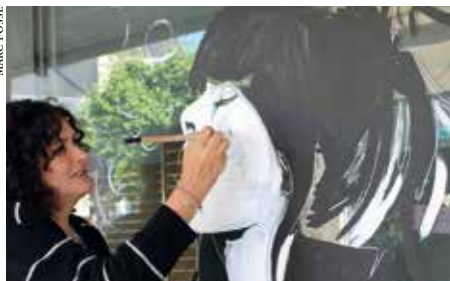
L'artiste Barbarella en plein travail.

Barbarella, vous portez le nom d'une héroïne de BD, qui êtes-vous ?