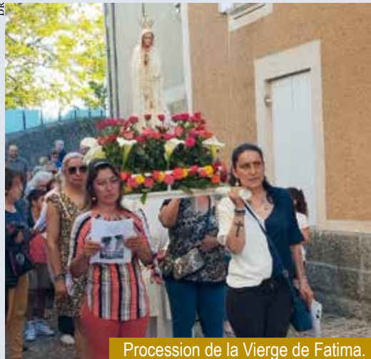
Procession de la Vierge de Fatima.

À Fatima, petit village au centre du Portugal, le 13 mai 1917, a eu lieu la première apparition de la Vierge Marie à trois enfants. Cette apparition et les suivantes seront vécues par les catholiques comme un grand soutien dans les difficultés liées au contexte très difficile – fin de la monarchie, début de la république, guerre mondiale – et à une économie qui s'effondre. À Pellegrue, la communauté portugaise s'est engagée pour commémorer l'événement. Une statue de Marie a été achetée à Fatima par une famille et un piédestal a été installé à l'entrée de l'église où elle trône. Depuis une dizaine d'années, le mois de mai est l'occasion pour toute la communauté catholique de Pellegrue de s'associer à la fête de Fatima. Cette année, la célébration a été préparée avec le même dynamisme : fleurissement de la statue magnifique, chants choisis et chantés en portugais avec toute la bonne volonté du chef de chœur, procession dans le village avec le soleil, et bien sûr, finale, avec le traditionnel apéritif. Cette belle rencontre donne du baume au cœur à tous les participants et le désir de faire encore mieux l'an prochain en préparant ce temps à partir du mois de mars avec toutes les familles concernées et motivées.