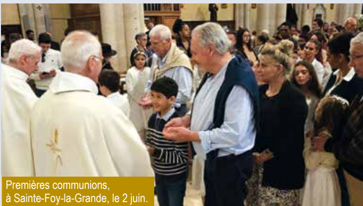
Premières communions, à Sainte-Foy-la-Grande, le 2 juin.