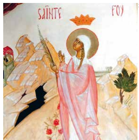
Ikône de sainte Foy dans l'église orthodoxe Sainte-Croix.

La première icône attestée fut réalisée par saint Luc au I er siècle. L'icône fut d'abord naïve puis, à partir du VII e siècle, elle fut codifiée de façon stricte au sein de la tradition byzantine afin de garantir la juste représentation des visages. L'icône est une fenêtre ouverte sur le royaume des cieux et nous permet de percevoir au-delà des apparences ce qui est dans la profondeur de la réalité. Ainsi, tel est le visage de Jésus dans le royaume des cieux, tel il est dans l'icône ; tel est le visage de Marie dans le royaume des cieux, tel il est dans l'icône. L'icône fait le lien entre le royaume des cieux et le fidèle. Elle est