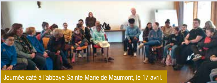
Journée caté à l'abbaye Sainte-Marie de Maumont, le 17 avril.