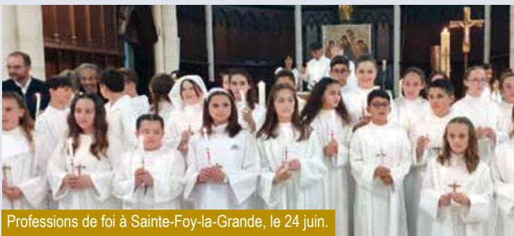
Professions de foi à Sainte-Foy-la-Grande, le 24 juin.