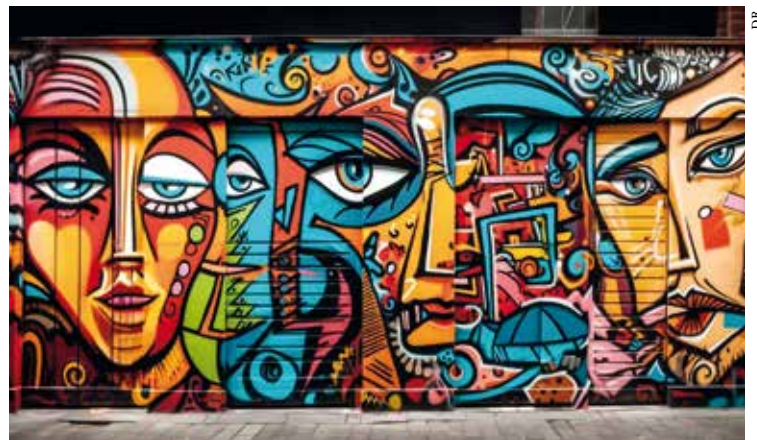
Grande fresque murale.