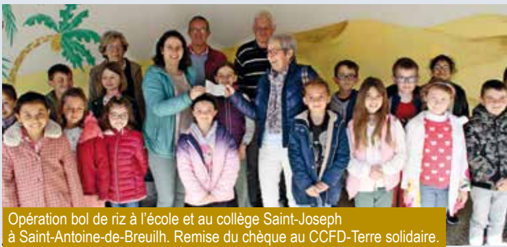
Opération bol de riz à l'école et au collège Saint-Joseph à Saint-Antoine-de-Breuilh. Remise du chèque au CCFD-Terre solidaire.