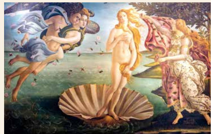
La naissance de Vénus, Alessandro Botticelli.

* La palestre : en grec ancien, désigne le lieu où étaient pratiqués les exercices physiques, lutte, gymnastique, course et autres disciplines.