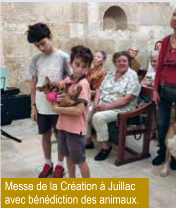
Messe de la Création à Juillac avec bénédiction des animaux.