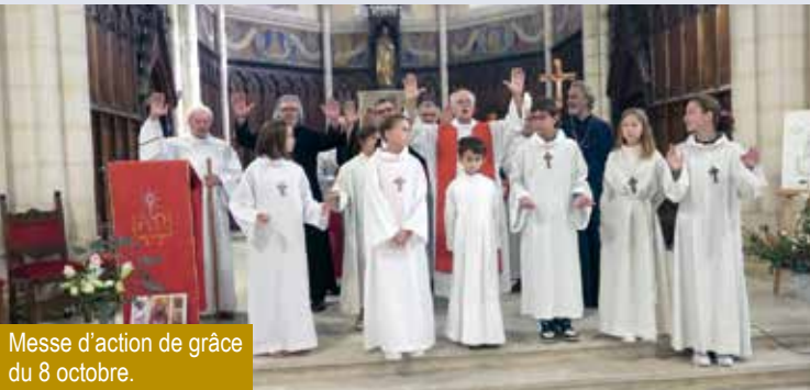
Messe d'action de grâce du 8 octobre.