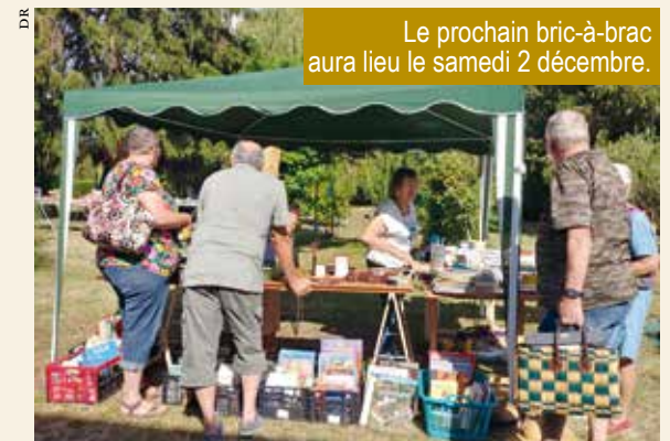
Le prochain bric-à-brac aura lieu le samedi 2 décembre.

Ces deux journées se sont déroulées dans une ambiance très conviviale et tout le monde s'est investi dans le rangement final. L'enthousiasme était tel qu'il fut décidé de reconduire ce genre de manifestation.