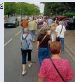
Manifester contre la désertification médicale à Sainte-Foy-la-Grande.

D'après les données 2021 de l'Organisation de coopération et de développement économiques (OCDE), les principales causes des problèmes de santé en France sont la consommation d'alcool et de tabac ainsi que le manque d'exercice physique chez les jeunes de moins de 15 ans, plus particulièrement chez les filles. Nous devons promouvoir un style de vie sain et actif. Le Pays foyen ne manque pas d'atout pour développer la marche, la bicyclette, le kayak et les autres activités de plein air. ■ Fiona Bonhoure