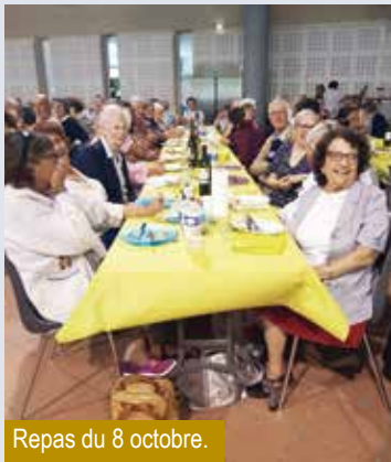
Repas du 8 octobre.