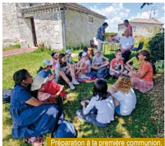
Préparation à la première communion.