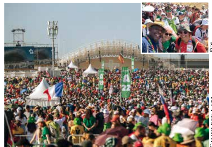
Messe finale des JMJ.

Les mots du pape ont résonné en moi d'une manière très forte. Le pape appelle à s'ouvrir aux autres, à ne pas se renfermer sur ses écrans, à aimer son prochain, à la solidarité.