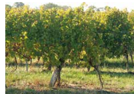
Le travail de la vigne se fait sur plusieurs années.

grille les raisins, mais il permet d'obtenir plus de sucre, donc du vin de meilleure qualité. Tous suivent avec intérêt la recherche et la création de nouveaux cépages mieux adaptés aux nouvelles conditions climatiques mais le chemin est encore long. Des expérimentations de panneaux photovoltaïques, pour protéger les vignes et fournir de l'énergie, ont été réalisées. Devra-t-on aussi un jour arroser les vignes ? Cela aura-t-il du sens alors que l'eau risque de manquer ? Restent les difficultés de commercialisation. Mais les viticulteurs gardent leur humour : « Les séries américaines nous font de la pub, ils ont