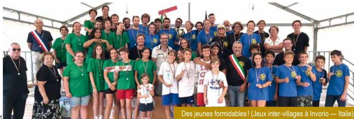
Des jeunes formidables ! (Jeux inter-villages à Inverio — Italie)