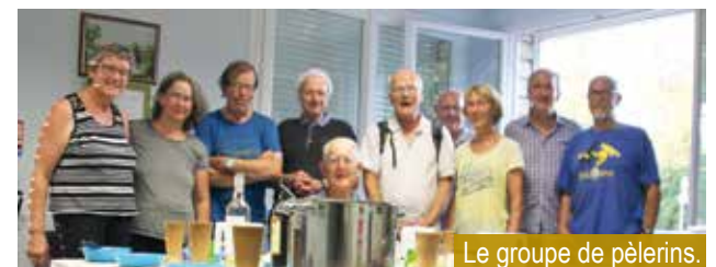
Le groupe de pèlerins.