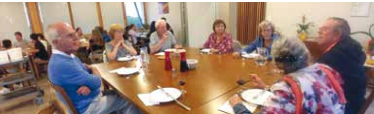
L'équipe d'animation pastorale (EAP) des 2Rives du Pays Foyen à l'abbaye de Maumont pour un temps de réflexion sur la mission.