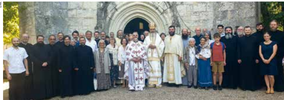
L'université d'été s'est tenue du 22 au 26 août au centre Sainte-Croix à Monestier.

exposés ont été diffusés par Zoom), ainsi que les dérives qu'elle occasionne notamment liées au développement du numérique. Ce dernier exerce un pouvoir hypnotique et addictif dont nous pouvons déjà constater les effets néfastes, en particulier sur les enfants. Ce pouvoir nous détourne de l'intériorité et de la prière au bénéfice du triomphe de l'artifice et du mensonge. Le réel est remplacé par le virtuel, la technologie nous entraîne dans une vision du monde conditionnée par une