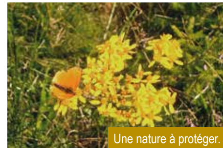
Une nature à protéger.

Dans le domaine technique, l'invention, la création d'outils ont allégé la pénibilité de certaines tâches. L'information arrive en continu, souvent sans filtre, provoquant des réactions instantanées. Les générations précédentes n'ont pas eu à gérer ces nouveaux médias, les enfants et les jeunes étaient plus à l'abri des turbulences du monde extérieur. Comment faire pour s'adapter à ces nouvelles technologies, à ce monde qui évolue si vite ?