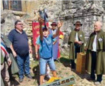
Lâcher de palombes baguées par des enfants de la commune.