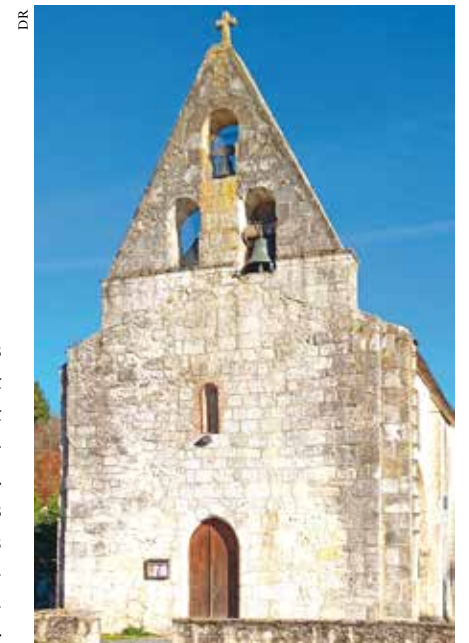
Église du Breuilh.

volonté : honorer Dieu et ses saints. Toutes les époques ont leur « bon goût », qui n'est plus forcément le nôtre. Sachons seulement reconnaître la qualité, le travail, pour rétablir, embellir ou compléter nos sanctuaires. Rien n'interdit de mettre notre patte dans ce travail séculaire. C'est ce que font les équipes paroissiales, mais aussi les municipalités propriétaires pour qui c'est souvent une lourde charge. Toutes ont à cœur d'entretenir le bien de tous et la politique cesse s'agissant du patrimoine. Aussi, il est du devoir de chacun de rendre hommage à ces efforts en sachant voir nos églises. Je n'ai pas l'ambition de procéder à une analyse savante et exhaustive de ce beau patrimoine, encore moins celle d'établir un