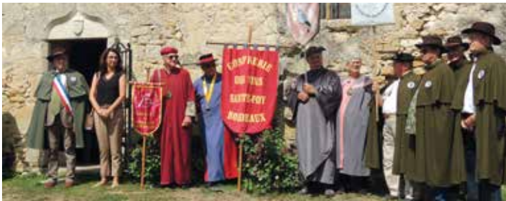
Les confréries devant l'église Saint-Barthélémy lors de la fête de la palombe le 22 septembre à Listrac-de-Durèze.