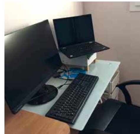
Le bureau d'Olivier aménagé à domicile.

Le télétravail a été particulièrement bénéfique parce qu'il a permis de réduire les trajets entre mon domicile (Saint-André-et-Appelles) et mon entreprise (Bergerac). Ce gain de temps sur la route a un impact sur les heures de travail effectives qui ont augmenté mais aussi sur la qualité de vie personnelle et familiale. Pour la majorité de mes collègues et dans une moindre mesure pour moi, cela peut accroître le risque d'isolement surtout pour ceux qui sont en 100 % distanciel depuis le début de la crise sanitaire. Pour ma part, je n'ai pas eu ce sentiment car je suis dans cette configuration que deux à trois fois dans la semaine. Malgré le retour progressif au bureau, je pense que le