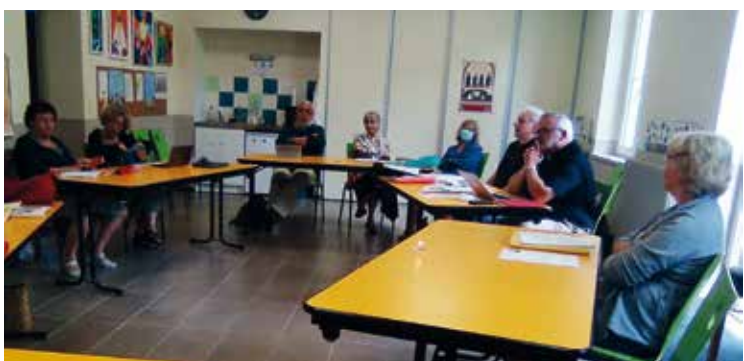
L'EAP au travail.