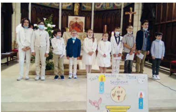
Les communiantes, le 6 juin à Sainte-Foy.