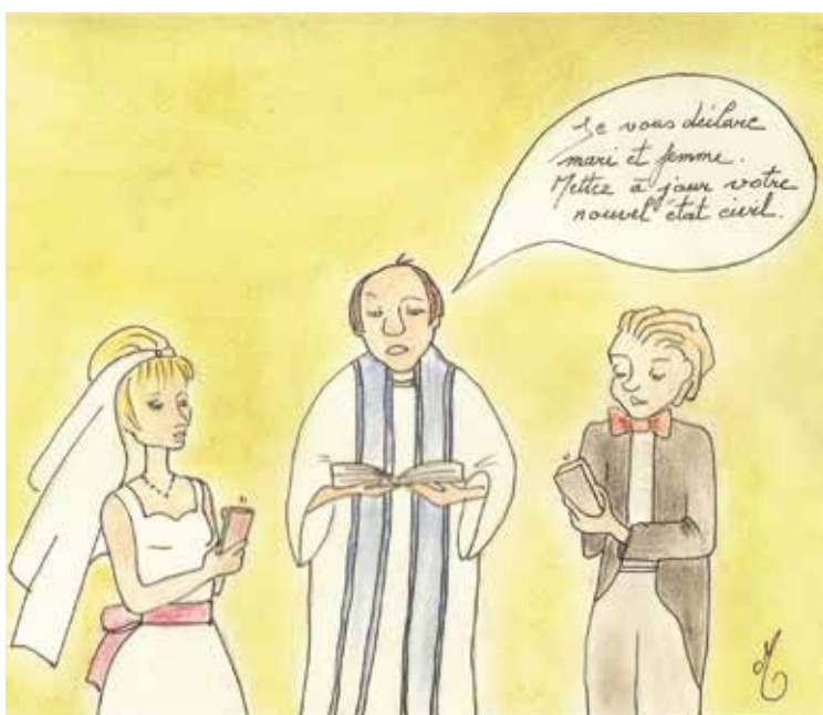
Cérémonie de mariage en présentiel.

L'Église ne l'utilisant plus, IBM le retient et celui-ci est déposé par la marque. Cependant, il passe très vite dans le langage courant et la société abandonne tous ses droits sur l'appellation.