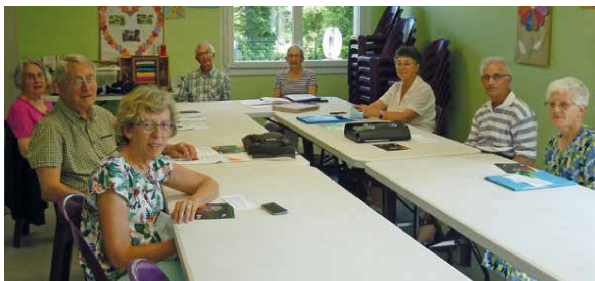
L'équipe locale du CCFD.

Créé en lien avec la pensée sociale de l'Église et à l'initiative des évêques de France en 1961, le CCFD regroupe 29 mouvements ou services d'Église. Comme son nom l'indique, son objectif est d'aider les populations des pays en voie de développement et d'œuvrer pour que chacun voie ses droits fondamentaux respectés. Grâce à de nombreux partenariats, le CCFD accompagne des projets imaginés et réalisés par des acteurs locaux.