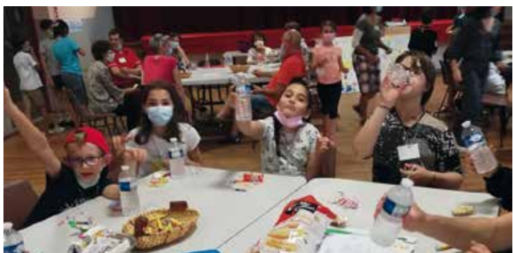
Retraite de communion à Montazeau.