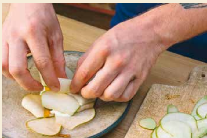
Capture d'écran du site wwf