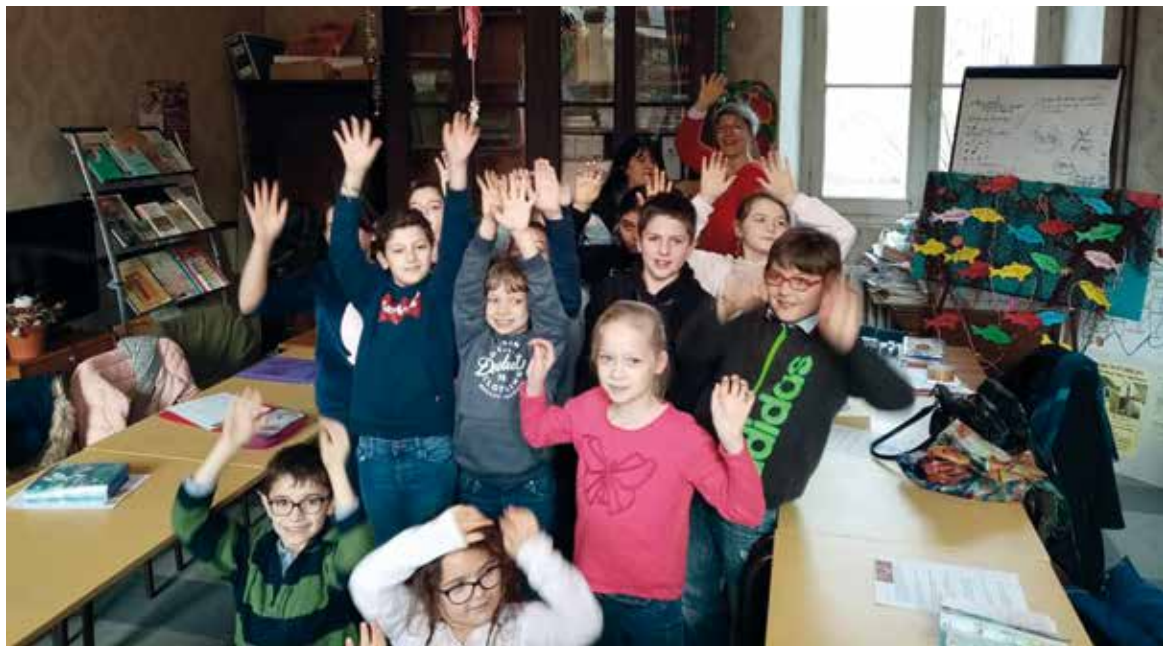
Les enfants qui devaient faire leur première communion. Photo prise avant le confinement.

On ne perd pas le contact ! Chaque semaine, dix enfants venaient le mercredi chez moi à Montazeau. Je prépare un courriel pour continuer le parcours que nous avons démarré ensemble en septembre.