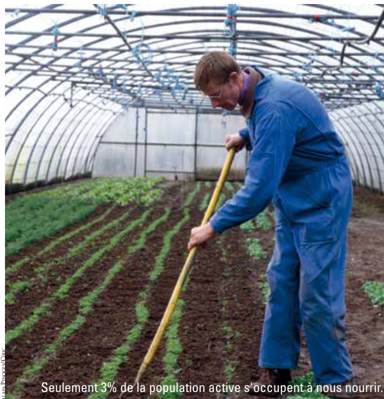
Seulement 3% de la population active s'occupent à nous nourrir.