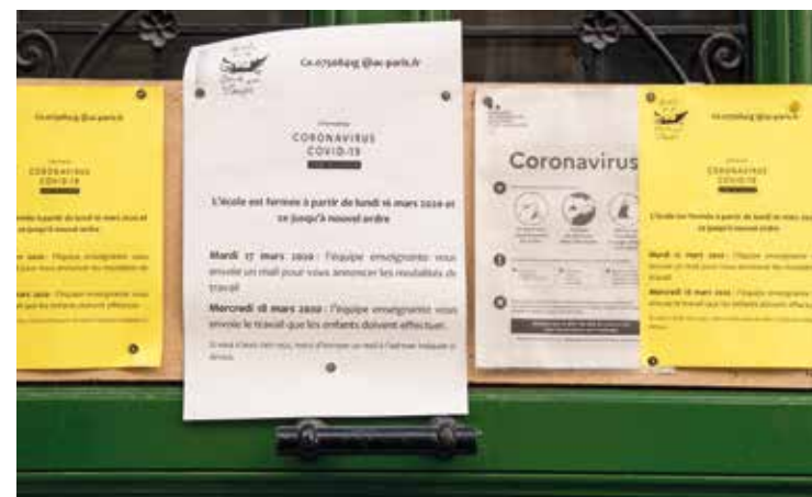
Circulaire d'information, affichée sur la porte fermée d'un collège.

Vendredi 13 mars l'école a fermé ses portes et les élèves sont rentrés à la maison pour ne plus y revenir et certains jusqu'en septembre.