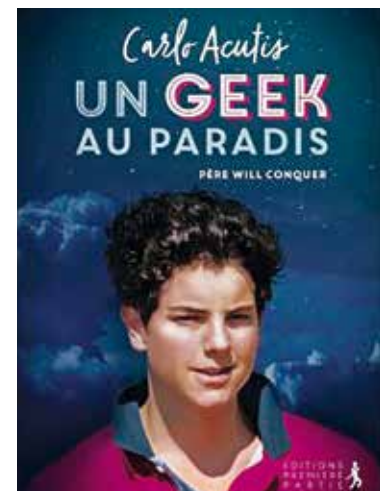
Biographie spirituelle sur Carlos Acutis, premier ado béatifié du XXI e siècle.