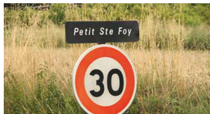
Le lieu-dit « Petit Sainte Foy » commune de Duras.

On doit au site polonais BIQdata une carte qui répertorie les villes et villages d'Europe portant le nom d'un saint. Elle tourne actuellement sur les réseaux sociaux pour rappeler à tous les racines chrétiennes de notre continent où 20 864 lieux commencent par « Saint ». La France se situe en tête suivie de l'Espagne et de l'Italie. Notons que Sainte-Foy est le nom de lieu le plus utilisé au monde.