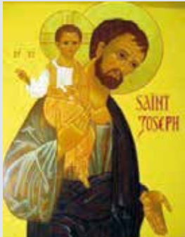
L'icône de saint Joseph qui sillonne notre unité pastorale.