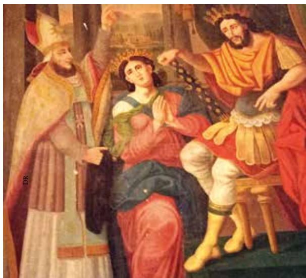
Sainte Radegonde dans l'église du village éponyme.

Autre cas de figure de saint qui vécut à la même époque dont les départements de la Dordogne et de la Gironde comptent une demi-douzaine de communes: Saint-Avit. Certaines existent toujours et sont