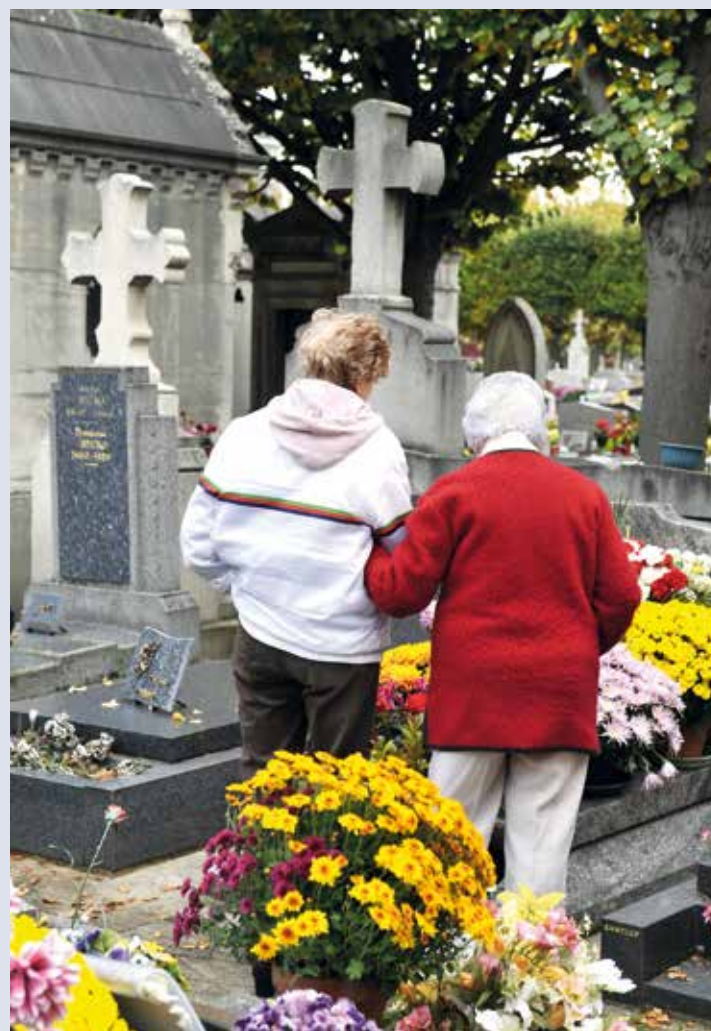
La Toussaint au cimetière.