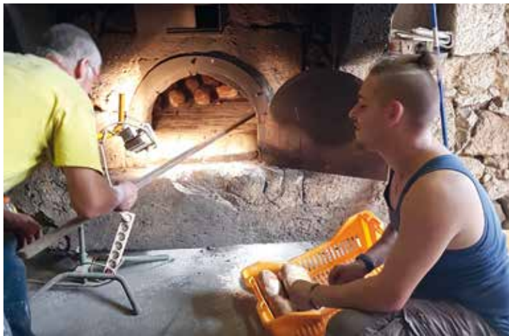
La fête du pain en août à Ponchapt.