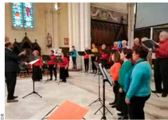
Zoom chorale lors de la fête du CCFD.