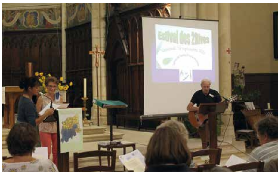
L'assemblée paroissiale du 10 septembre.