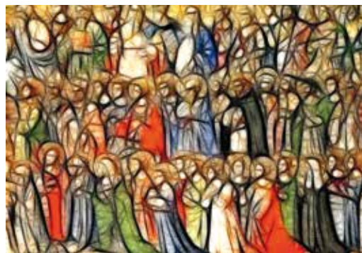
Saints- All Saints de Gerd Altman

* Une vie bouleversée, Etty Hillesum (journal 1940-1943)- Éditions du Seuil