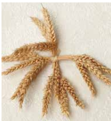
Une traditionnelle croix de Saint-Jean

Autrefois, dans notre société agricole, c'était une période de travail intense et laborieux qu'il ne fallait pas manquer afin d'être tranquille pour l'année à venir. En témoignent les croix de Saint-Jean, bénies en même temps que les feux puis installées à l'entrée de la maison ou de la grange, elles protégeaient la famille durant