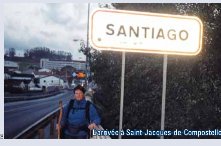
L'arrivée à Saint-Jacques-de-Compostelle.