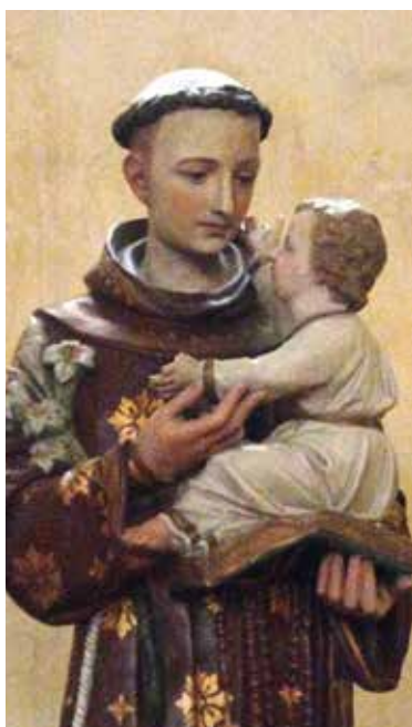
Invoquer saint Antoine de Padoue pour retrouver un objet perdu (église de Sainte-Foy).

Dieu serait-il proche de chacun sans relâche ? Même dans les petits instants futiles ? Touché par la confiance d'un petit garçon ? Et, d'un même coup, offrant bienfait à l'enfant et pied de nez à la maman ! C'est peut-être ce que l'on appelle