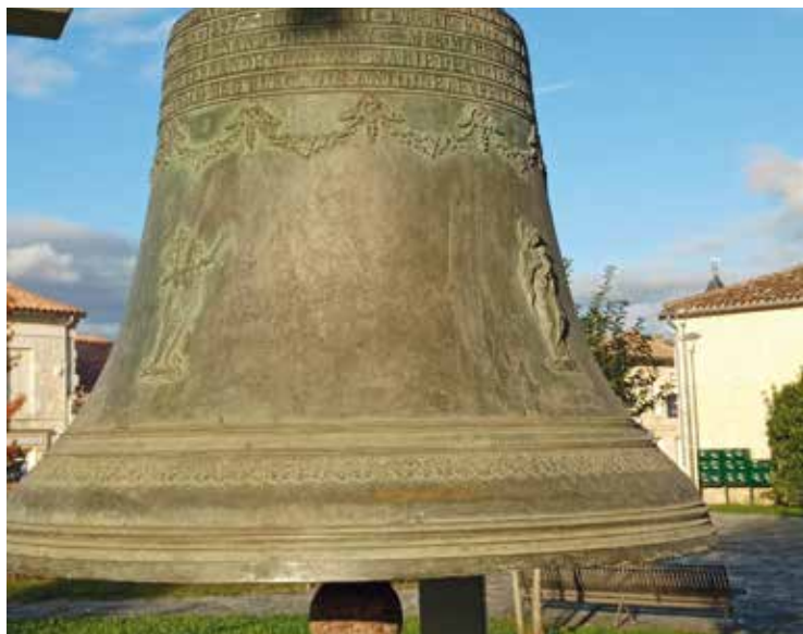
En 1919, par testament, l'abbé Lafont précisait: « Cette cloche, devrait-elle prier silencieuse pendant un siècle pour la population qui me fut chère, doit rester à Saint-Antoine-de-Breuilh. » Elle est désormais installée sur la place au cœur du village.