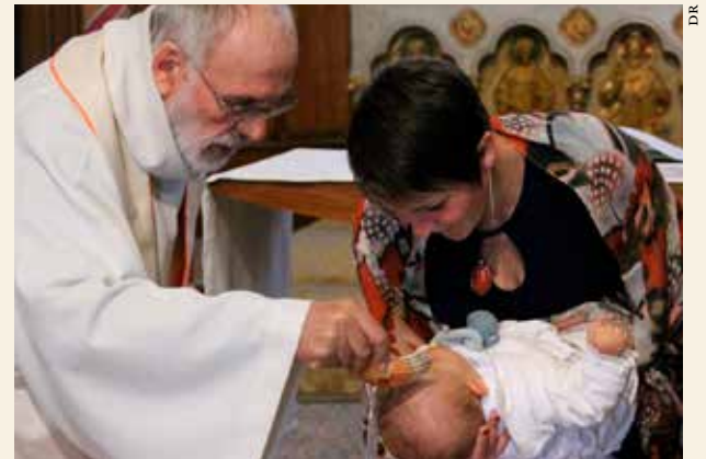
L'eau du baptême.

L'eau est le plus représentatif des signes du baptême. Symbole de vie et de purification, ce rituel peut être rapproché de la vie intra-utérine qui précède la naissance.