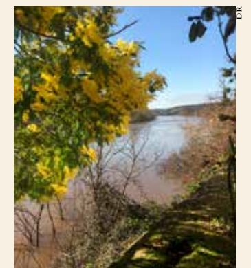
Bords de Dordogne.