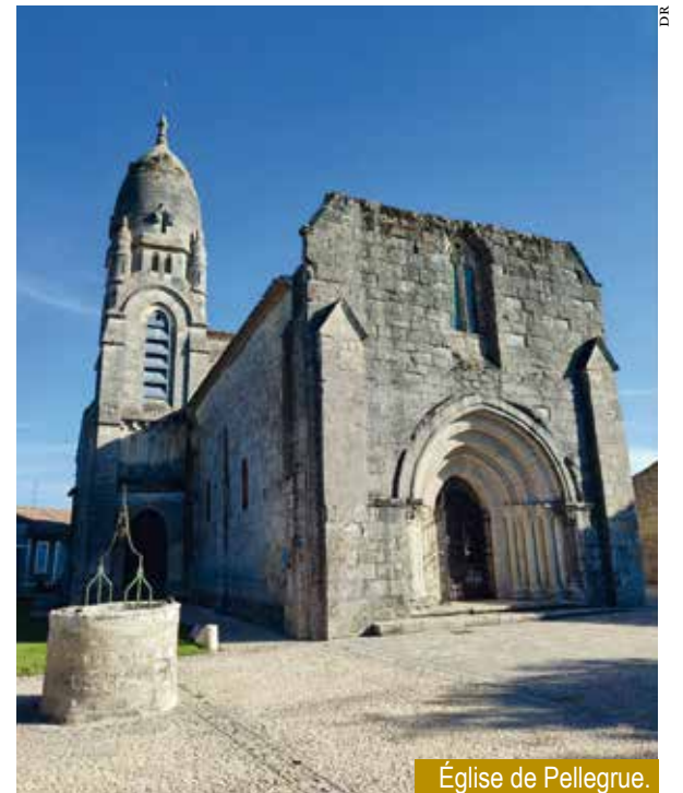
Église de Pellegrue.

À Doulezon, la magnifique église romane a été édifiée sur les ruines d'une villa gallo-romaine dont les restes se prolongent sous le parking. Une carrière de pierre toute trouvée, comme ce fut bien souvent le cas. Une colonnette de marbre, sans doute du Languedoc, n'a pas eu un long chemin à faire pour orner le porche. Si l'on fait le tour, on ne peut qu'admirer le parfait appareil des pierres,