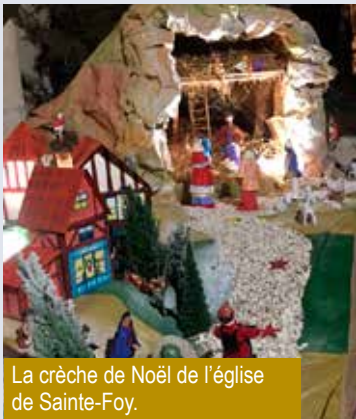
La crèche de Noël de l'église de Sainte-Foy.