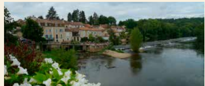
La Dordogne au Fleix.

« Eau tu n'as ni goût, ni couleur, ni arôme, on ne peut te définir, on te goûte sans te connaître... Tu n'es pas nécessaire à la vie, tu es la vie », écrivait Antoine de Saint-Exupéry. C'est pourquoi, depuis toujours, l'homme t'a rendu un culte et, par nécessité, installait son campement près des rivières. Des traces de rites balnéaires pratiqués jusqu'à la chute de l'Empire romain ont été retrouvées. Tes sources portaient les noms de divinités tutélaires auxquelles des cadeaux et des ex-voto étaient offerts pour les guérisons que l'on t'attribuait. Au Moyen Âge, ce sont les saints qui protégeaient tes sources. Beaucoup portent encore leurs noms. Châteaux, abbayes, moulins, forges furent érigés le long de tes cours d'eaux. Tu offres aussi la pluie qui féconde la terre. Danses, prières pour t'implorer se retrouvent dans presque toutes les civilisations; encore de nos jours des communautés indiennes les pratiquent. Tu purifies nos corps et, depuis Jésus-Christ, selon la croyance chrétienne, tu nous purifies du mal. Le « baptême » — du mot grec baptizein — qui signifie plonger, immerger — est un sacrement partagé aujourd'hui par les Églises chrétiennes: dans cette immersion totale ou partielle tu symbolises le passage de la mort à la vie accompli par le Christ. Tu peux, cependant, trop abondante ou souillée devenir notre malheur. La mer Rouge a englouti les armées du pharaon d'Égypte et le déluge avait anéanti le peuple de Dieu devenu pervers.