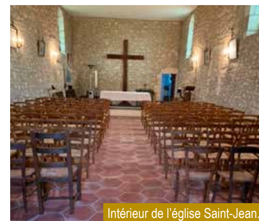
Intérieur de l'église Saint-Jean.

La rénovation de l'église Saint-Jean de La Roquette, rare exemple d'édifice religieux, simultanément affecté aux cultes catholique et protestant, est maintenant terminée. La municipalité a financé la pose d'un nouveau carrelage et la paroisse, avec l'aide de donateurs, le remplacement des anciens bancs par des chaises. Un office œcuménique célébré le 25 février a marqué la réouverture de cette bâtisse du XVIII e siècle. ■ Jean Régner