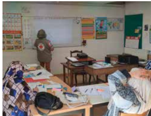
Cours de français langue étrangère à Sainte-Foy.

La Croix-Rouge de Sainte-Foy, je l'ai choisie car je cherchais à aider les gens et à m'aider moi-même, sans distinction ! J'ai appris qu'on y faisait du français langue étrangère et j'ai couru y proposer mes services, CV en main. Cette aventure a commencé il y a huit ans et je ne m'en lasse pas ! Aider et participer à cette fraternité au sein d'une équipe où le secours est un maître-mot, cela vous fait vous lever tous les matins avec la volonté de partager avec vos semblables et d'envisager de bouger des montagnes, même si souvent ce ne sont que des gouttes d'eau. Un sourire, un bonjour, discuter autour d'un thé, le coup de fil pour savoir si demain il y a « classe » malgré les vacances, oui, on y arrive et on persiste malgré les pas en avant et en arrière, c'est la vie ! La Croix-Rouge de Sainte-Foy n'est plus à présenter, une équipe toute dévouée de