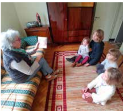
La petite bibliothèque du Carême.