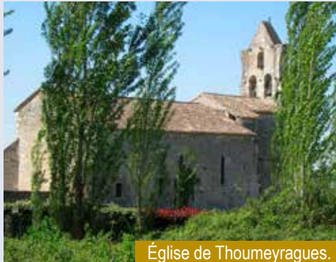
Église de Thoumeyragues.

C'est le risque auquel je m'expose et je l'assume, heureux, si je suis lu, d'apporter une réflexion, un recul, une réaction. Et, en préambule, je le signale, je ne parlerai jamais des objets mobiliers qu'on peut admirer dans certains sanctuaires, notamment des tableaux provenant de la générosité, au XIX e siècle, de Chaix-d'Est-Ange, puisés dans sa fabuleuse collection. Il ne s'agit pas d'attirer l'attention des mandrins qui en sont à dérober des carrelages en terre cuite ! Pour en revenir à cette promenade, l'impression est celle de l'extrême diversité. Aucune de ces églises ne se ressemble, chacune a son âme. On me dira : « Une église, c'est une église, toutes se valent. » Canoniquement, c'est sûr, même si certains sanctuaires, basiliques ou cathédrales sont revêtus d'un caractère particulier et si l'office a la même valeur, que l'on soit à Saint-Pierre de Rome ou dans la plus humble chapelle. Pourtant, que de diversité ! Entre celles qui sont demeurées telles que conçues à l'origine et celles dont on voit, dont on sent qu'elles ont subi au fil des siècles, au gré d'événements souvent tragiques, des modifications, des ajouts, voire des reconstructions, l'uniformité n'existe pas, si ce n'est un point commun : celui de conserver un lieu où abriter le culte et les fidèles. C'est ainsi qu'on peut imaginer comment nos ancêtres aimaient leur église, où ils priaient, recevaient les sacrements et se réfugiaient le cas échéant.