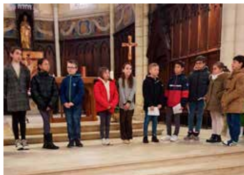
En chemin vers la première communion.