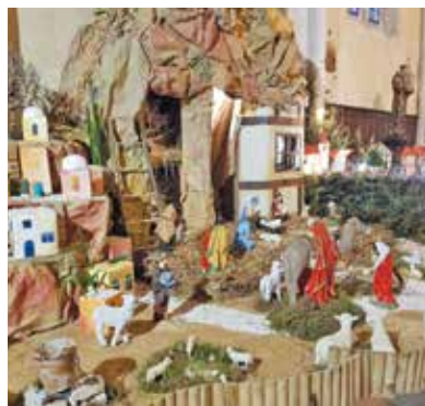
Crèche dans l'église de Sainte-Foy.