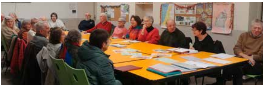
Assemblée générale de l'association Terres de Foy.