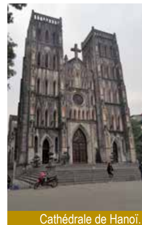
Cathédrale de Hanoï.

Après des adieux chaleureux, merci, thank you, căm ăn , il referme la grille derrière nous. Son sourire et son accueil, aussi inattendus que chaleureux, formidables cadeaux, restent l'un de nos meilleurs souvenirs de voyage.