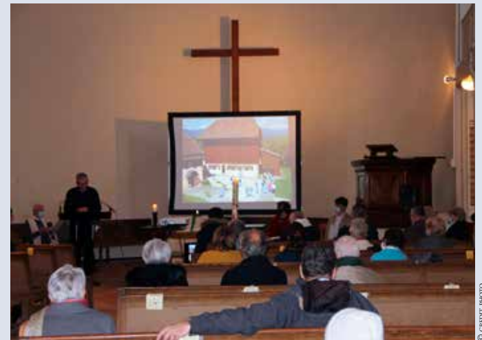
La célébration œcuménique du dimanche 24 janvier

Comme chaque année, les Églises chrétiennes nous invitent à une semaine de prière mondiale pour l'unité des chrétiens du 18 au 24 janvier. L'engagement œcuménique n'est pas une dimension facultative de la vie d'un chrétien mais un devoir et une obligation, cette semaine est donc un des temps forts de l'année liturgique. Le pays foyen, historiquement marqué par la division des chrétiens, est d'autant plus appelé à vivre ce moment avec intensité.