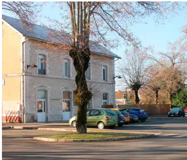
La gare de Vélines et son parking.