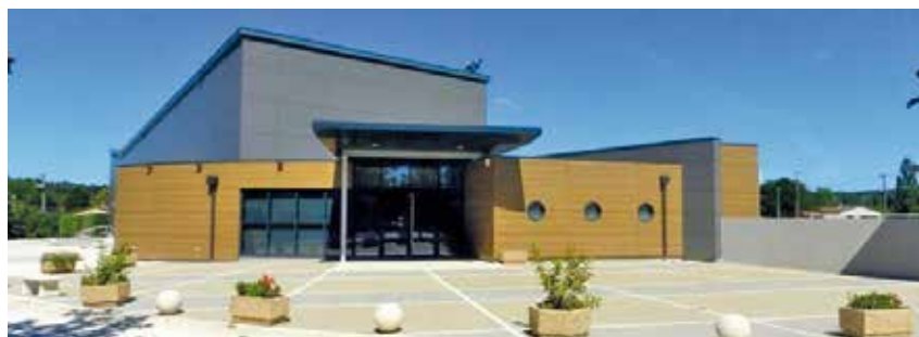
Le Fleix, entre tradition et modernité.

des kinésithérapeutes, un psychologue, un ostéopathe, un podologue et des infirmières. De nombreuses associations sportives, caritatives et d'animations sont aussi présentes et participent à la vie communale, tant pour les jeunes que pour les anciens. Une particularité de notre commune est que nous bénéficions de deux écoles, l'une publique et l'autre privée,