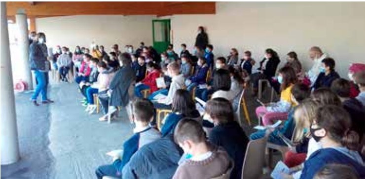
Célébration de Noël à l'école Saint-Joseph de Saint-Antoine-de-Breuilh.