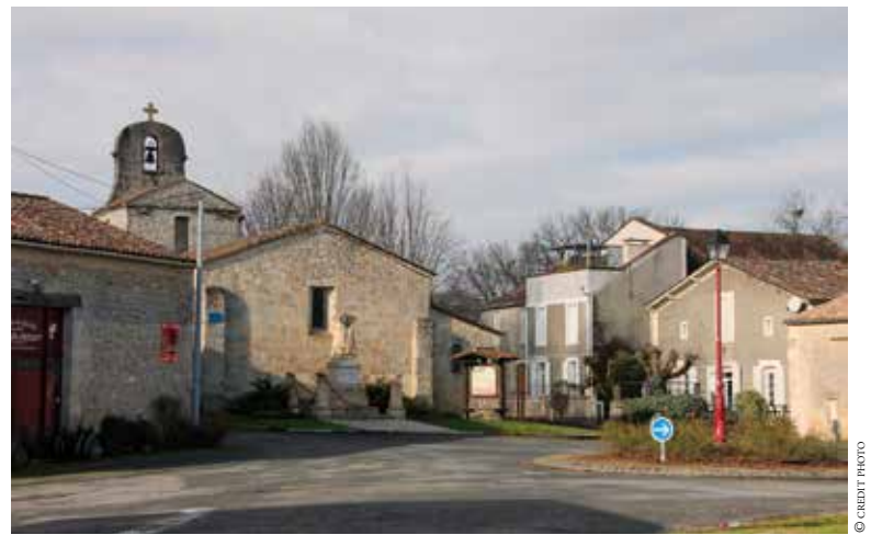
Le bourg de Ponchapt.

Le bourg est fier de posséder sa propre salle des fêtes, il faut dire que les fêtes ne manquent pas : repas cochonnailles, fête du pain, fêtes des vendanges. Il y a aussi