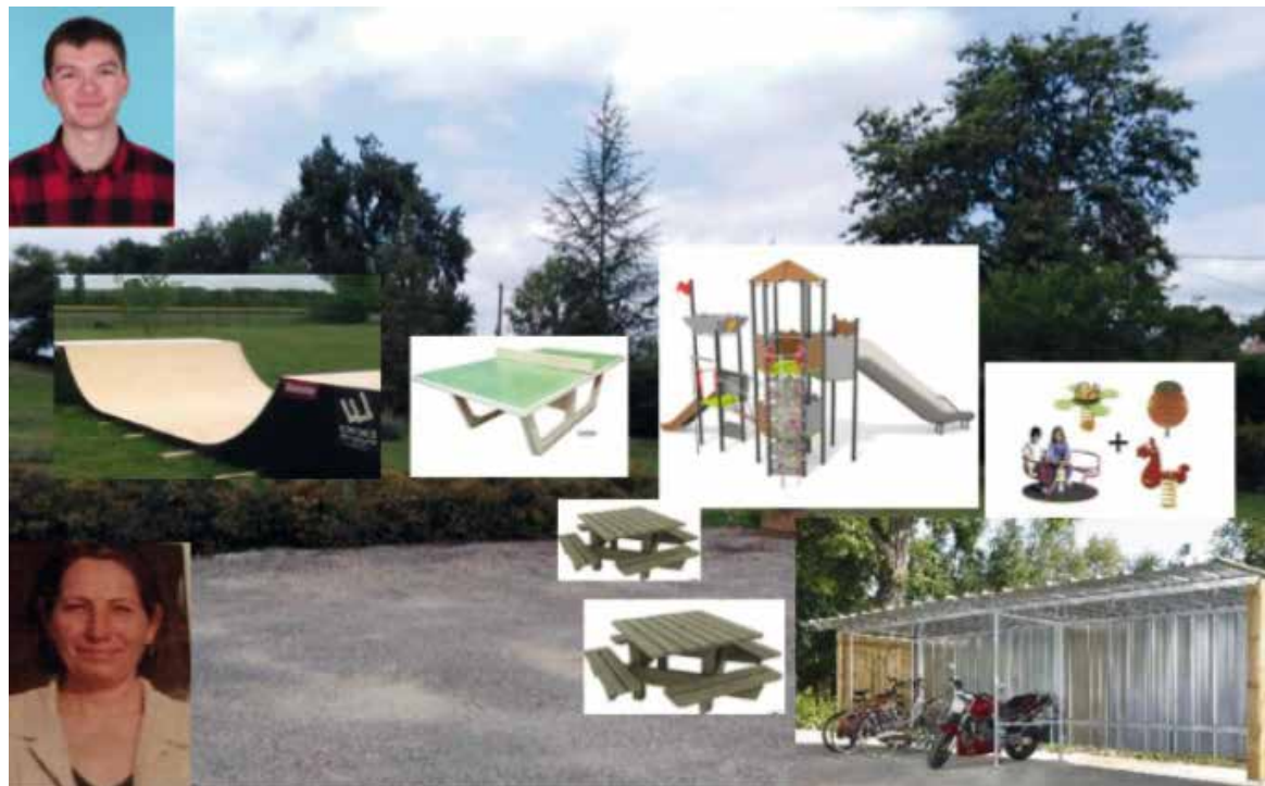
Le projet initié par Adrien Delluc et Isabelle Pillon.

Ligueux est une commune rurale de 173 habitants. Les lieux d'activités pour les jeunes sont éloignés d'une dizaine de kilomètres sans moyen collectif de déplacement. Le confinement a accentué l'isolement et créé le besoin d'autre chose que le portable, les jeux vidéo, internet.