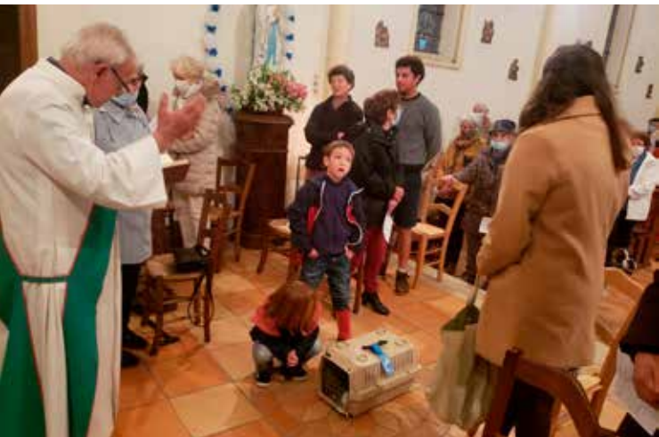
La messe de la création à Port-Sainte-Foy.