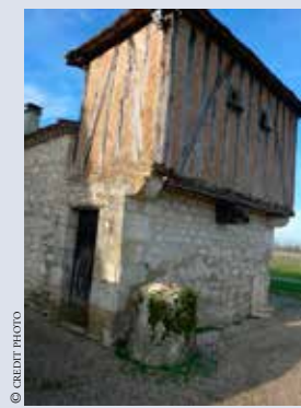
Pigeonnier à colombages au Pourcaud (Saint-Avit-Saint-Nazaire).

Le pays foyen est une terre charnière aux confins de la Gironde, du Périgord et du Lot-et-Garonne. Proche des vignobles de Duras, Monbazillac, Saint-Émilion, desservie par l'aéroport international de Bergerac, cette région offre de nombreuses possibilités de loisirs et de visites pour un tourisme rural, familial et gastronomique. L'office du tourisme encourage les hébergements et veille à la qualité de leur accueil. Les gîtes de Port-Sainte-Foy et Pellegrue sont des étapes sur le chemin de Compostelle. Des circuits de randonnées existent sur toute la région. La route des vins en est un. Bastides, châteaux, églises, lavoirs, pigeonniers sont autant de sites à visiter que l'on soit à pied, à vélo ou en voiture.