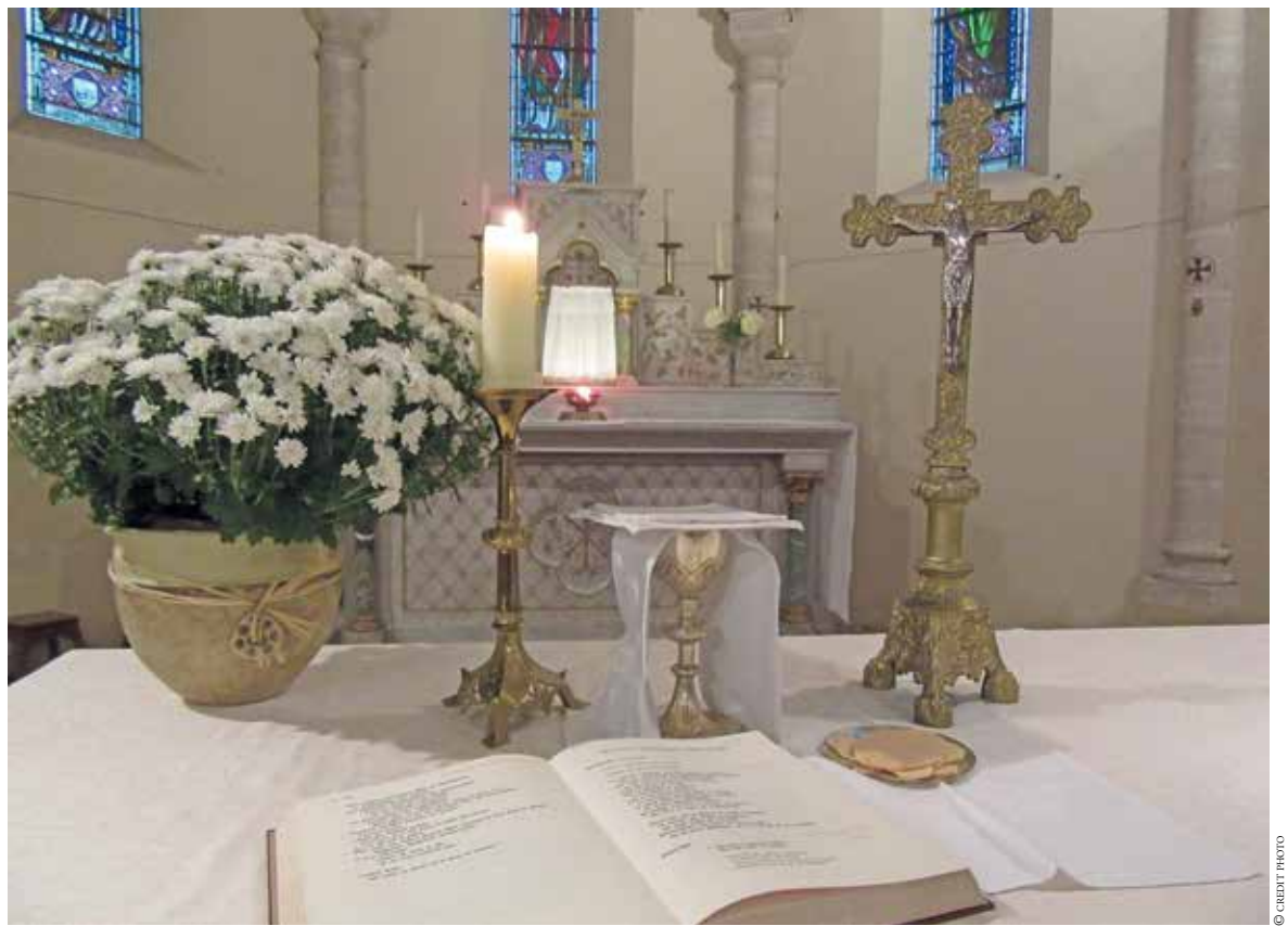
Le Livre ouvert sur l'autel dans l'église de Saint-Martin-de-Pineuilh.

Alors, comment rejoindre les membres dispersés de cette communauté ? Comment continuer à être en communion ?