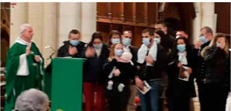
Messes des fiancés le 14 février à l'église de Sainte-Foy.