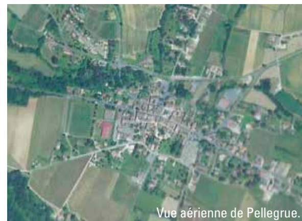
Vue aérienne de Pellegrue.

Alors que dans l'imaginaire français le village occupe une place de prédilection, une petite musique annonce régulièrement son déclin inéluctable : en surnombre, minuscule, vieillissant, isolé.